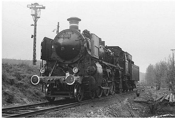
DRG Baureihe 18